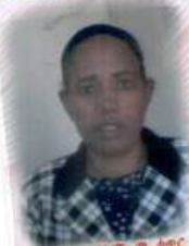
Lakk.W/E ሙ. ቀጥር