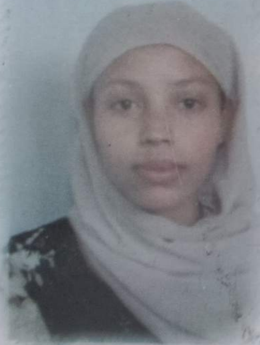
Lakk.W/E መ. ቁጥር